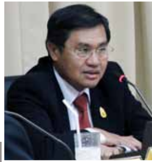
ตรวจเยี่ยมกองส่งเสริม งานคุ้มครองผู้บริโภค ด้านผลิตภัณฑ์สุขภาพ ในส่วนภูมิภาคและท้องถิ่น

นพ.บุญชัย สมบูรณ์สุข เลขาธิการฯ อย. ตรวจเยี่ยม กองพัฒนาศักยภาพผู้บริโภคร (กอง พศ.) เนื่องในโอกาสเข้ารับ ตำแหน่งเลขาธิการฯ อย. และมอบนโยบาย ณ ห้องประชุม กอง พศ. อาคาร 5 ชั้น 6 ตึก อย. เมื่อวันที่ 12 ตุลาคม 2555