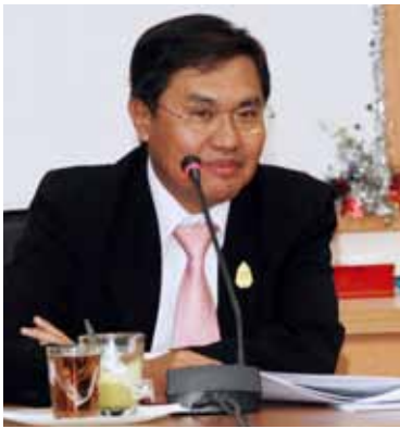
ตรวจเยี่ยม กองพัฒนาศักยภาพ ผู้บริโภคร