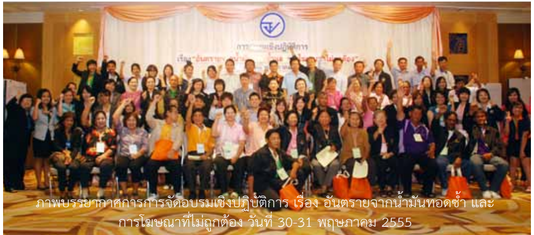
ภาพบรรยากาศการการจัดอบรมเชิงปฏิบัติการ เรื่อง อันตรายจากน้ำมันทอดซ้ำ และการโฆษณาที่ไม่ถูกต้อง วันที่ 30-31 พฤษภาคม 2555

ต่อจากฉบับที่แล้ว คณะทำงานภาคประชาชน ได้มีการประชุมต่อเนื่องเป็นประจำทุกเดือน เพื่อติดตามและรายงานความคืบหน้ากิจกรรมที่ร่วมกันดำเนินการตามแผน โดยการประชุมคณะทำงานภาคประชาชนครั้งสุดท้ายเป็นครั้งที่ 7 ประชุมในเดือนสิงหาคม 2555